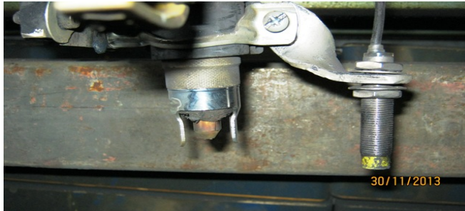
<<== Örnek Uygulama Bağlantı Diyagramı.

Kullanım Kılavuzu: Start Butonuna basıldığında Z Eksenine kesilecek metal nesneyi görünceye dek aşağıya inecek ve kesilecek metali görünce mesafesini korumaya devam edecektir. Kesilecek yüzeyde alçalma veya yükselme olması durumunda Torç Kafası önüne (5cm. Uzağa) takılmış olan sensör kesilecek metal ile seviyesini korumak için Z Eksenine motorunu sağa-sola çevirerek kesim yükseklik konumunu korumaya devam edecektir.