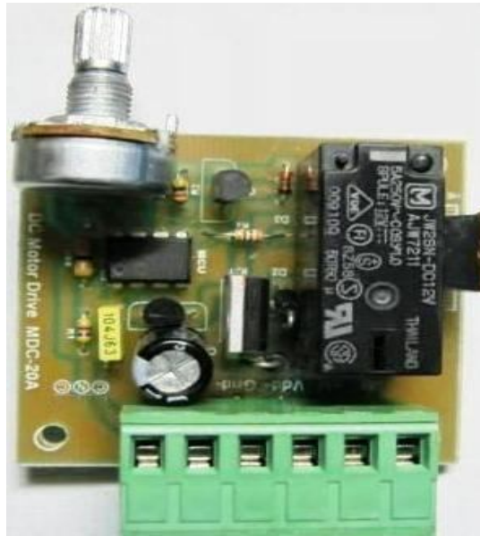
MDC20-A Programlı DC Motor Sürücü